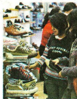
Retail más dinámicos.

Dijo que las empresas aprovecharían este escenario para refinanciar sus deudas con menores tasas. “Podrían